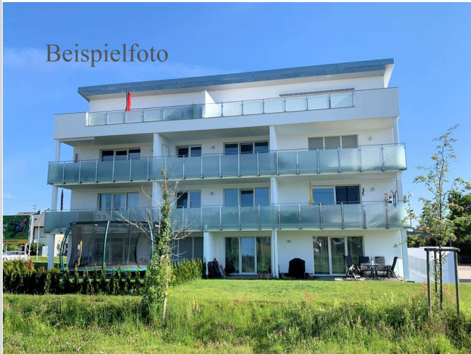
Beispielfoto Objekt Schramberg

Zimmer: 3,00 Wohnfläche ca.: 104,00 m 2 Kaufpreis: 322.803,00 EUR